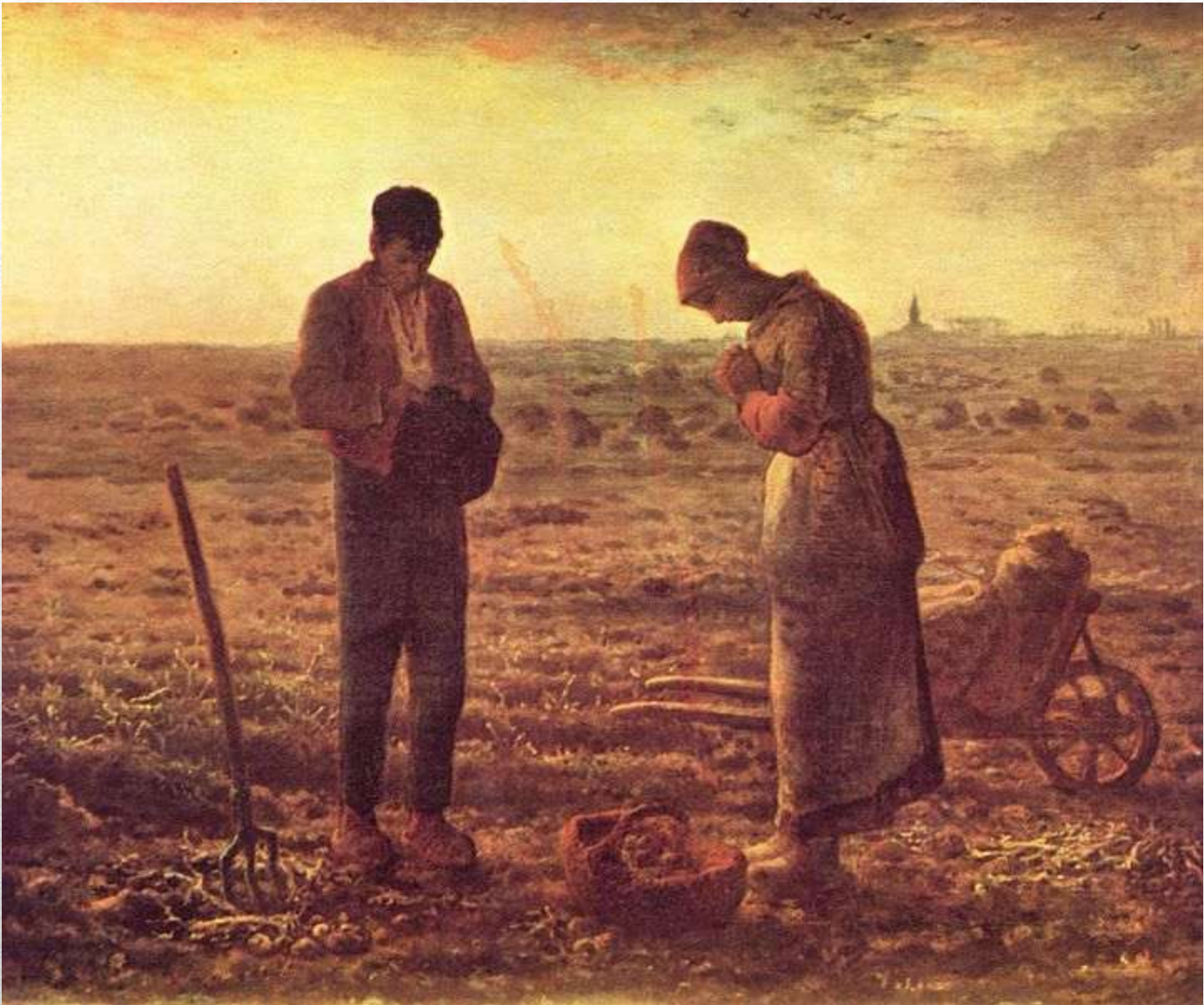
Obr. 8 Jean-François Millet – Anděl Páně