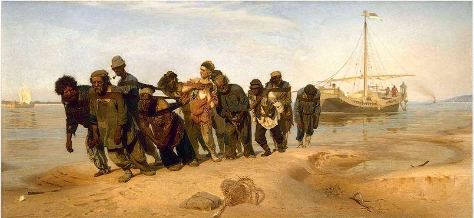
Obr. 4 Ilja Repin – Burlaci na Volze