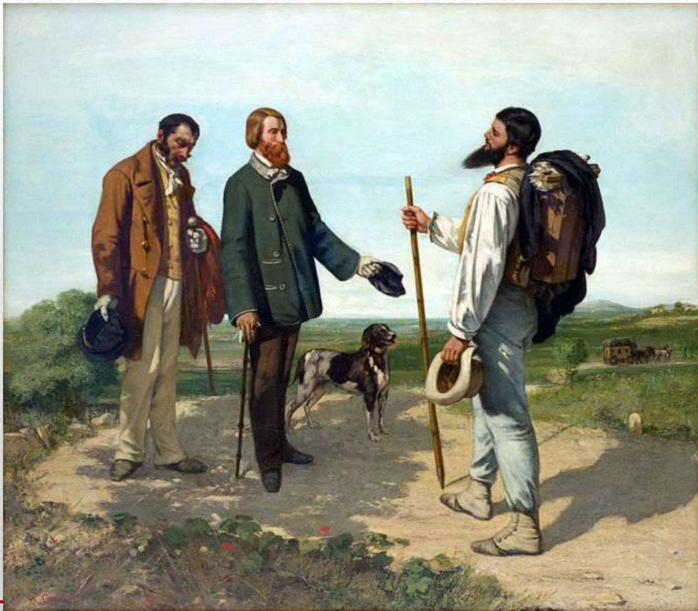
Obr. 1 GUSTAVE COURBET - Dobry den, pane Courbete