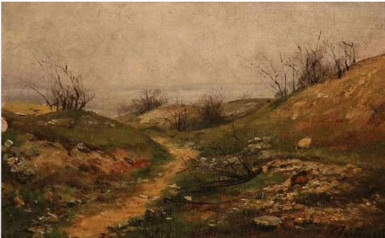
Obr. 7 Antonín Chittussi – Cesta k moři