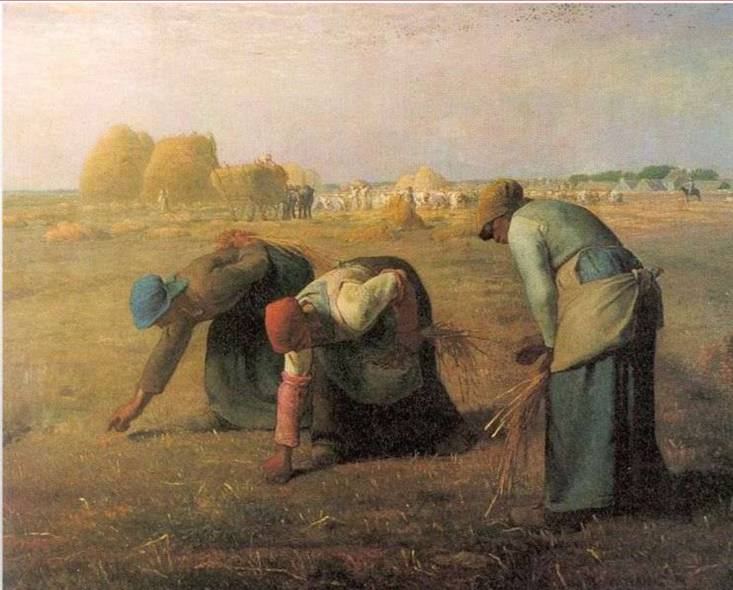
Obr. 9 Jean-François Millet – Sběračky klasů