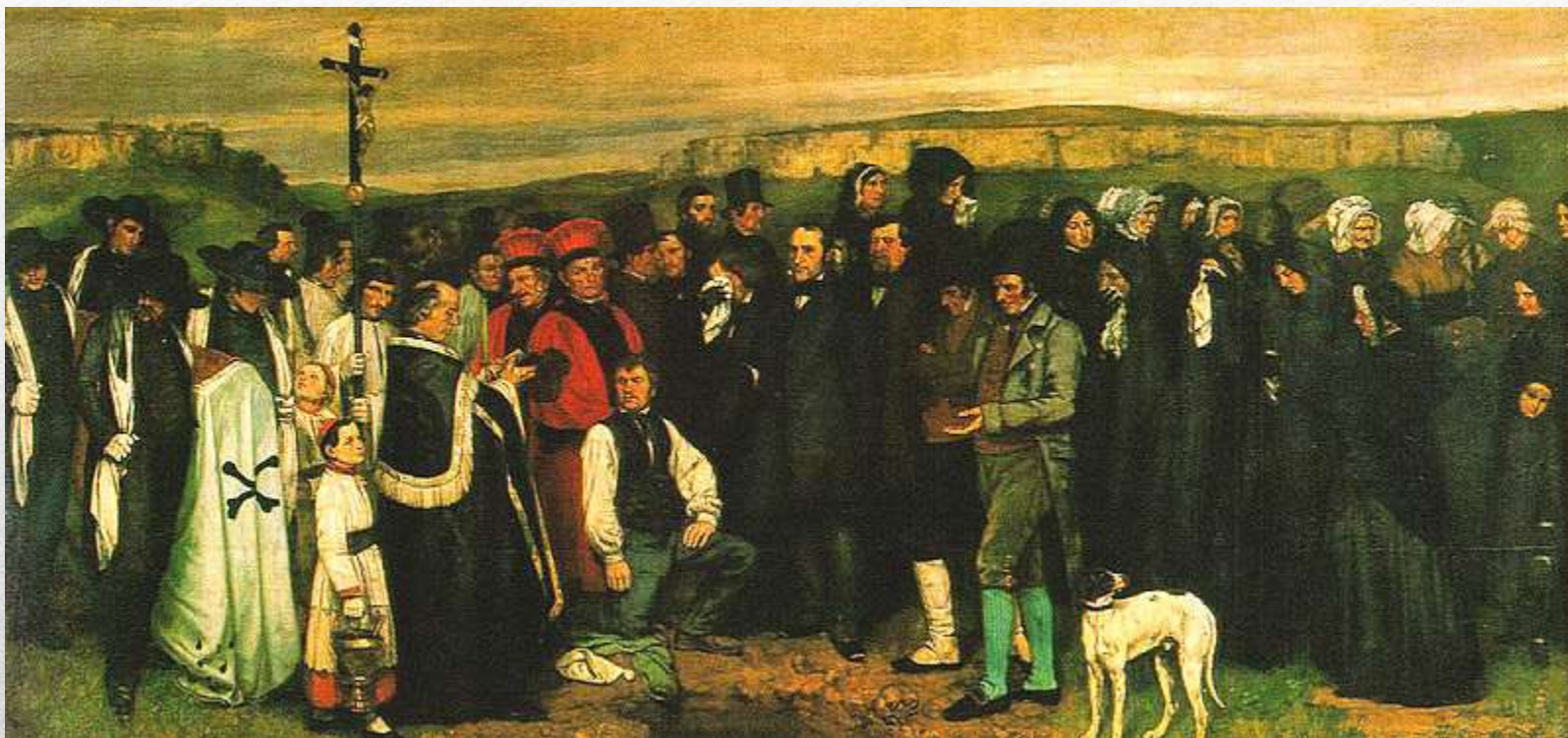
Obr. 3 GUSTAVE COURBET - Pohřeb v Ornans