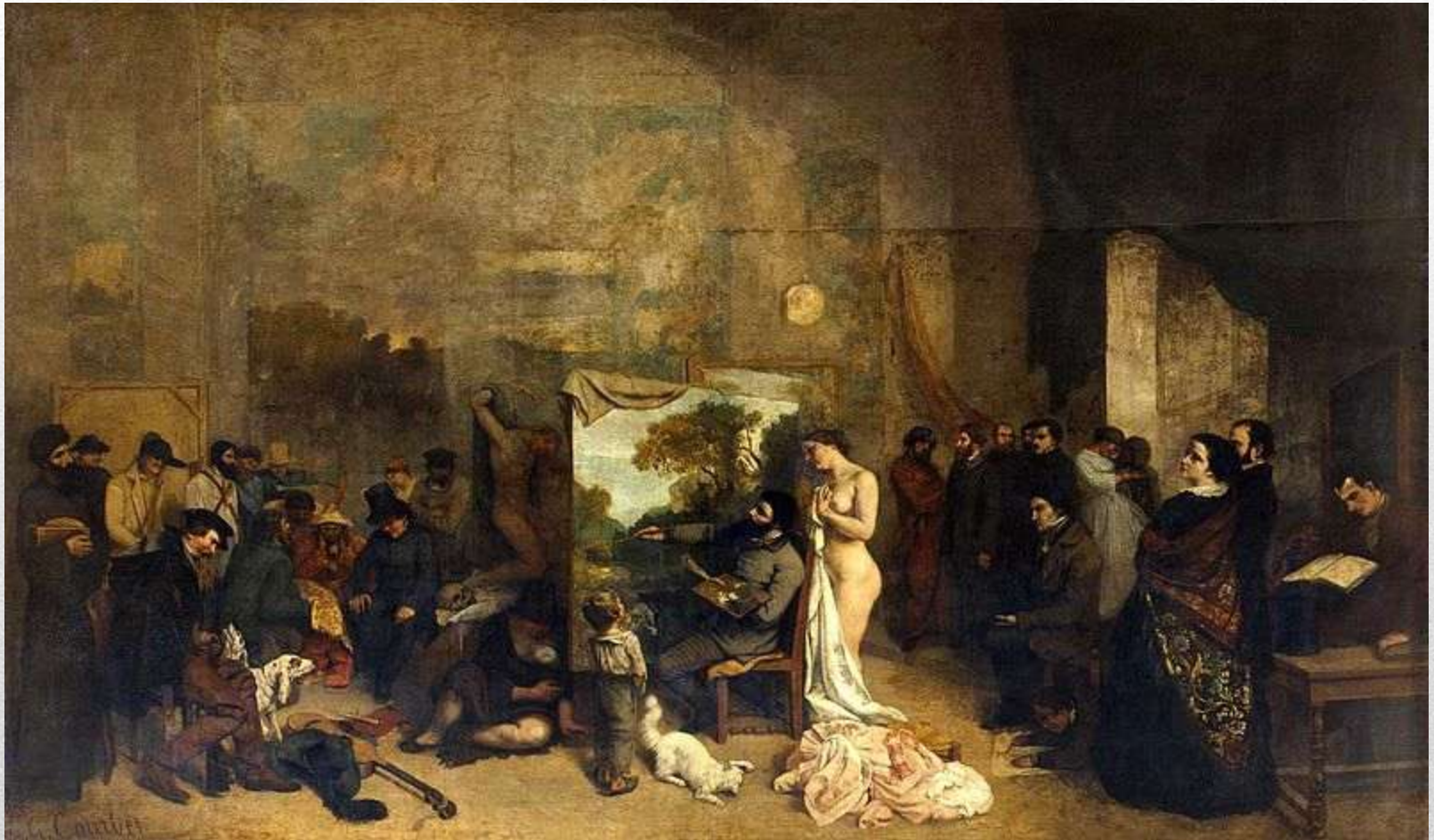
Obr. 2 GUSTAVE COURBET - Ateliér